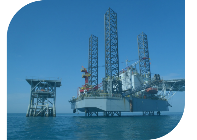
عرب دريل ٢٠ ٢٣ سنة