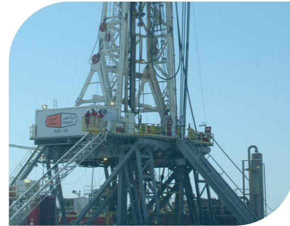
عرب دريل ١٥ ٥ سنوات