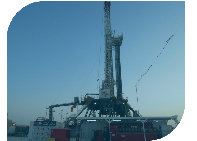
عرب دريل ٦٥ سنتين