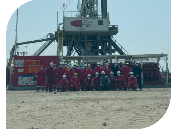
عرب دريل ٢١ ٣ سنوات