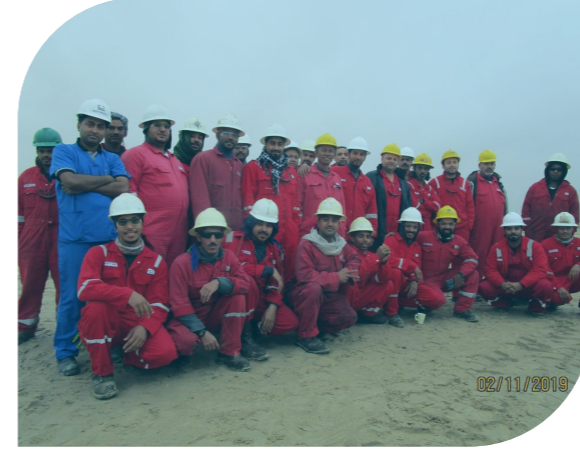
عرب دريل ١٢ ١٣ سنة