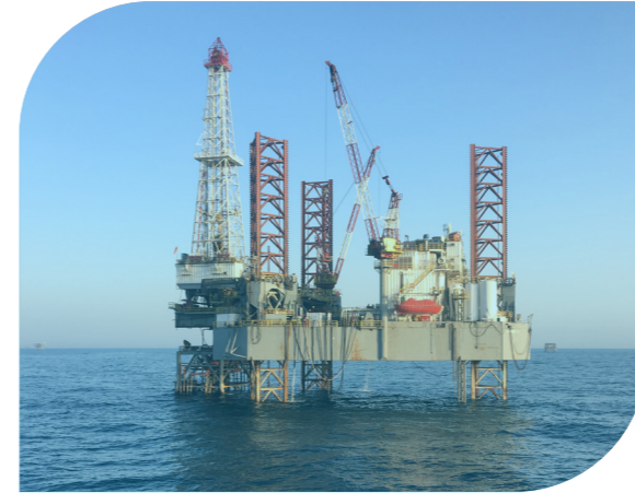
عرب دريل ٨٠ سنتين